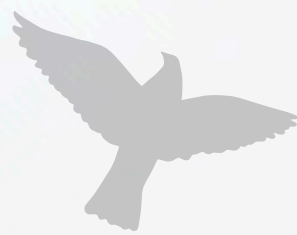
Kachin 缅甸难民 学校服务 Kachin Refugee Learning Centre Service