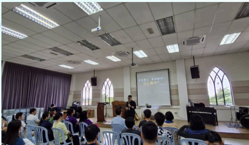
卫理公会中二教区 青年事工研讨会 Methodist Central District 2 Youth Ministry Conference