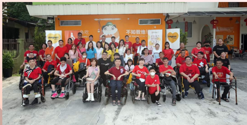
双福【爱回家】之 送你回家过年 Dual Blessings Lunar New Year Program